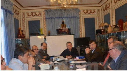
Quang cảnh buổi hội thảo bàn tròn tại Thương vụ Đại sứ quán Việt Nam ở Pháp.

Một hội thảo mang tên “Kinh tế Việt Nam và Pháp: Kết quả năm 2014 và triển vọng năm 2015” với sự tham dự của nhiều học giả và chuyên gia kinh tế người Việt Nam và Pháp vừa được Thương vụ Đại sứ quán Việt Nam tại Pháp tổ chức.